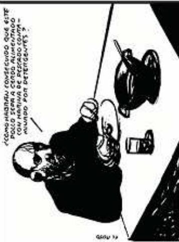
¿COMO HANAN ROVESCENDO QUE ESTE POUO ZEPH A CERRO ALUMENADO CON UNO DE LOS PERROSO CON UN MANDO NON PERDENDOS?

Tot i l'efort que està en mans privades i els governs han perdut pràcticament qualsevol possibilitat de definir quin aliment ha de produir un país.